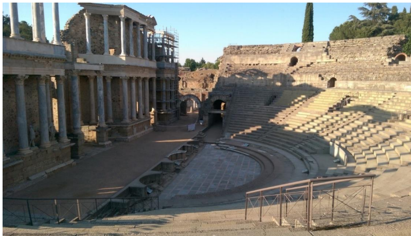
Römisches Theater in Mérida (Spanien), 15 v. Chr.