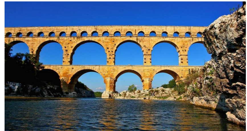
Pont du Gard, Südfrankreich, 1. Jh. n. Chr.