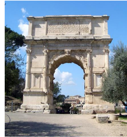
Titusbogen, Rom, 81 n. Chr.

Latein und die römische sowie griechische Kultur bilden die kulturellen und geistigen Grundlagen Europas.